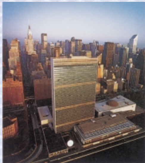
国連本部(ニューヨーク) 全世界から集まった4700人以上の人々都在这里働いています。

事務局はさまざまな国連機関に役務を提供し、また各種国連活動を管理する機関で、ニューヨークの国連本部や世界各地で働く国際公務員から構成されます。これらの職員は国連の日常業務を遂行します。国連職員はほぼ9000人を数え、およそ160の国々から集まった人々です。