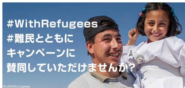
UNHCRの「#難民とともに」キャンペーン

人の移動の形は多様で、移民はそれぞれ社会の一員としての横顔を持っています。世界各地の移民のストーリーをウェブサイトやソーシャルメディアなどで紹介して、人の移動や移民のポジティブな側面を伝えています。